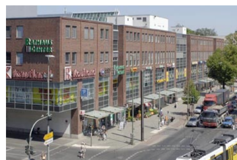
Top-Adresse in Pankow

Dabei leistet die W.I.S. alle zentralen Funktionen der Sicherheit: Die W.I.S. stellt das Service-Team in der Brandmeldezentrale, bestreift bei Bedarf die gesamte Mall, führt sämtliche