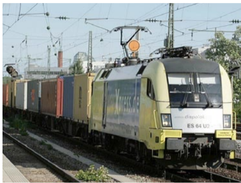
Eine der Schnellsten: die BoxXpress-Lok

für Züge, die im Hafen ankommen. An dieser brisanten und hochkomplexen Schnittstelle setzt die Zusammenarbeit zwischen BoxXpress und der Hamburger W.I.S. ein: Im Jahre 2004 suchte