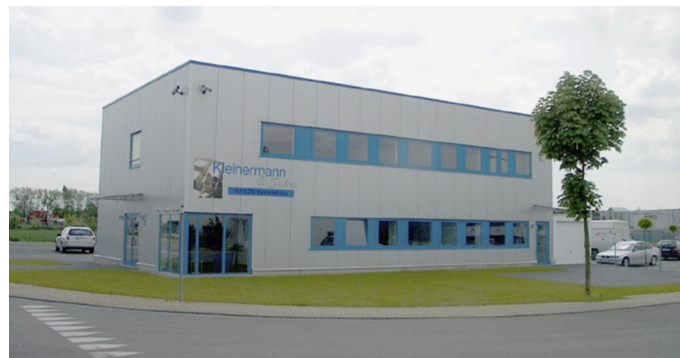
Die Zentrale des bundesweiten Netzwerks in Baesweiler

Kleineremann: Da ist grundlegend ein hohes Maß an Seriosität und Personalqualität. Hinzu